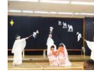
クリスマスページェント