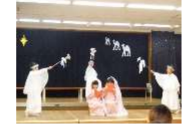
クリスマスページェント